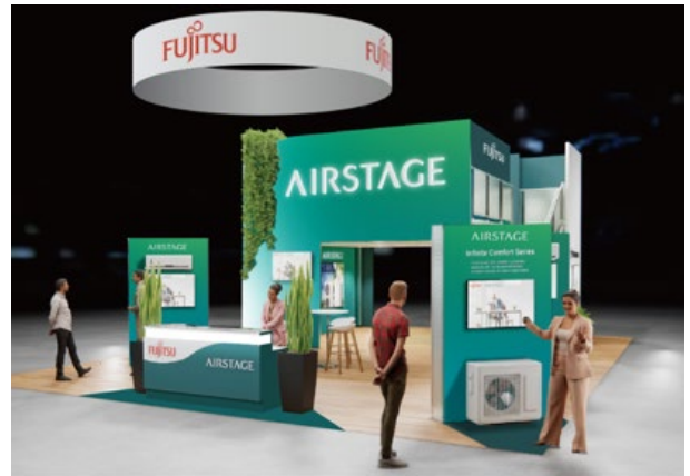
当社ブースイメージ

会 期：2024年1月22日～24日（現地時間） 来 場 者：約5万人（2023年実績 約4万人） 出 展 企 業：約1,600社 会 場：McCormick Place （米国イリノイ州シカゴ） ブ ー ス 番 号：#S7764 公 式 サ イ ト： www.ahrexpo.com/