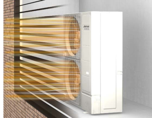
ファンから出る送風の抵抗に 60Pa まで対応しているため、目隠しフェンスで覆われていても性能が低下しにくい。

※1 2018年3月30日現在。当社調べ。16HP クラスにおいて。高さ 1,638mm×幅 1,080mm×奥行 480mm。