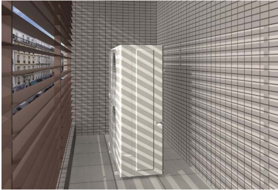
目隠しフェンスで覆われたバルコニーに設置した「AIRSTAGE」J-ⅢL シリーズ (イメージ図)

室外機の排熱口を縦吹き型から横吹き 2 ファン型に変更するとともに、独自の高密度熱交換器の搭載など構成部品の最適化を図り、室外機の奥行を 480mm に抑え、16HP クラスで業界最小 ※1 となるコンパクト室外機を実現しました。従来機種と比べても、設置面積で約 45%削減し、搬入時もエレベーターに載せ易くするなど、施工性の向上を図り、建物との間やバルコニーなどの狭小スペース、目隠しフェンスで覆われた場所など、直接目に触れない場所への設置が容易になりました。さらに、静圧は 60Pa までの送風抵抗に対応し、目隠しフェンスのある場所でも設置が可能です。これらにより、小規模店舗や事務所などで、設置レイアウトの選択肢が広がり、設備設計の自由度が高まります。