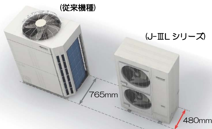
業界最小の小型室外機 「AIRSTAGE」J-ⅢL シリーズ 14/16HP(写真：右)

2018年度は、今回発売の14/16馬力を投入する事で、欧州市場におけるさらなる売上拡大を目指します。