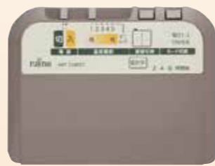
薄型コントローラー