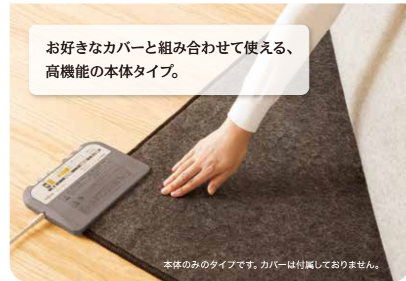
本体のみのタイプです。カバーは付属しておりません。