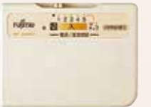
薄型コントローラー