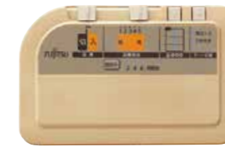
薄型コントローラー